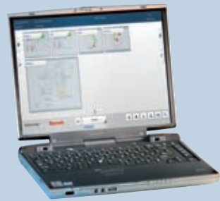
Normaler Arbeitsplatz 1 User