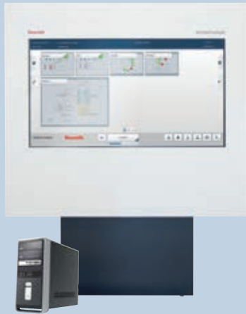
Linie 1 Multi User Device